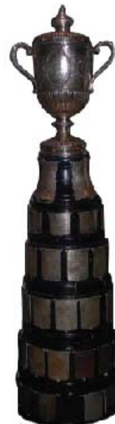
Trophée Québec Challenge

Match impliquant plusieurs clubs simultanément. Chaque club doit inscrire au moins deux équipes par piste. La compétition initiale eut lieu au Forum de Montréal.