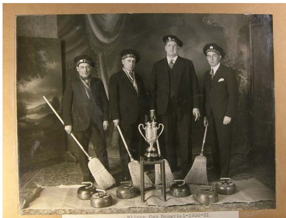
Club de curling Grand-Mère 1931

Une quarantaine de clubs répartis au Québec et dans la région d'Ottawa étaient associés à la Filiale canadienne en 1874-1875. La majorité d'eux jouaient avec des fers et ce n'est qu'en 1955 que la transition aux pierres en granite fut achevée.