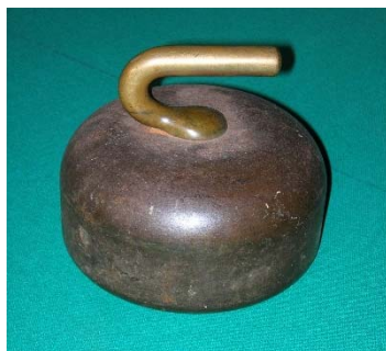
Fer de curling